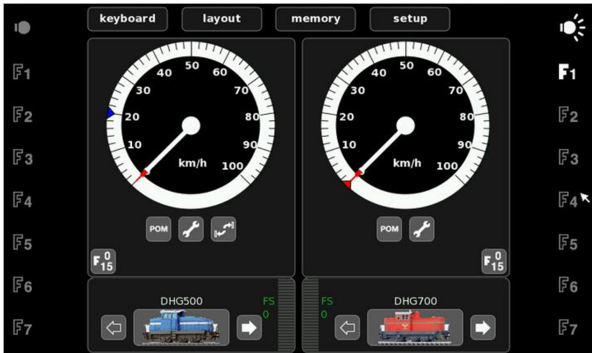
Abb 3: Pendelzugfahrt einrichten

Öffnen Sie dann mit Klick auf den Schraubenschlüssel unter dem Tacho den Konfigurationsdialog für die DHG700. Für die DHG500 gibt es hier bereits eine Pendelzugfahrt (und damit ein weiteres Icon rechts unter dem Tacho).