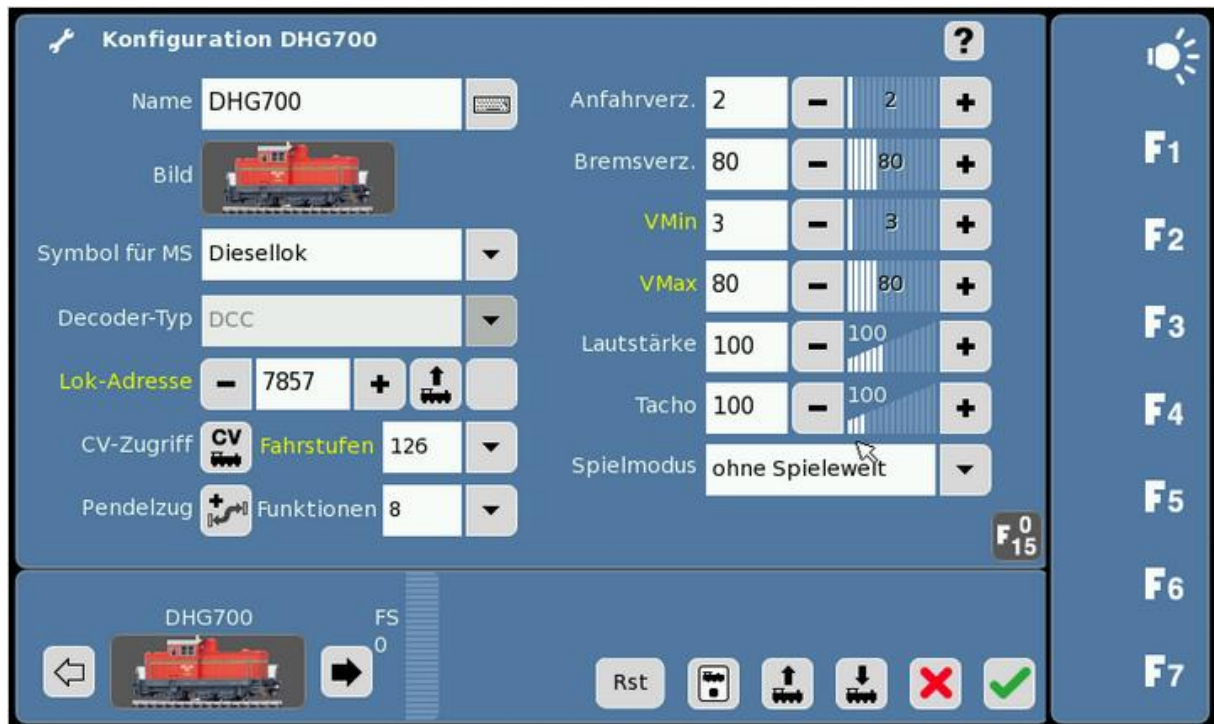
Abb 4: Bremsverzögerung einstellen

Die Bremsverzögerung bestimmt bei diesem Pendelzug, wie weit die Lok nach Auslösen des Melders fährt. Mit Klick auf das Icon hinter „Pendelzug“ öffnet sich der Dialog „Pendelzugstrecke“ für die Lok.