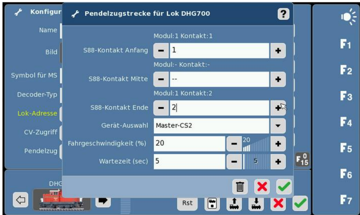
Abb 5: Kontakte für Pendelzugstrecke auswählen

Unter S88-Kontakt Anfang tragen Sie „1“ ein, unter Ende „2“. S88-Kontakt Mitte lassen sie leer „--“!