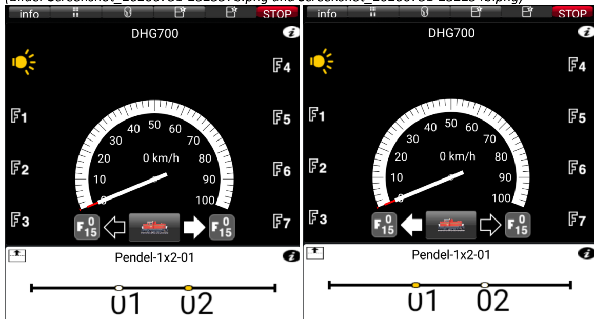
Abb 6: Pendelfahrt mit Auslösen der Kontakte

(Bilder Screenshot_20200731-232357b.png und Screenshot_20200731-232254b.png)